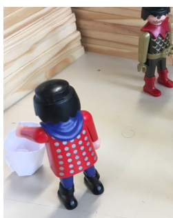
11 – Le nettoyage