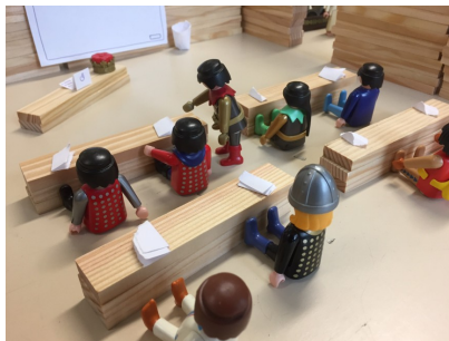
7 – La vérification du matériel