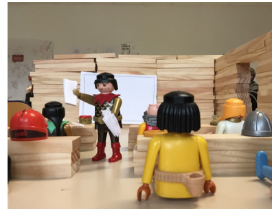
5 – La distribution des porte-vues