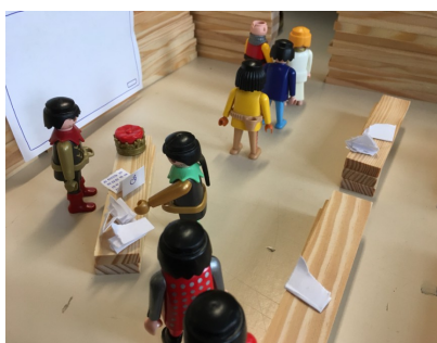
10 – La restitution des porte-vues