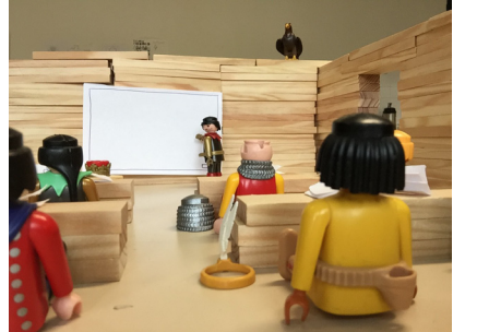
6 – Le lancement ou le bilan