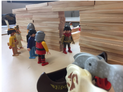
1 – L'accueil des élèves

Par Laetitia REBERAC, Carole DE DUYSCHÉ, Sophie MEYNARD, Jean-Baptiste ROUILLER & Christophe LOGET. GTAA—Novembre 2016