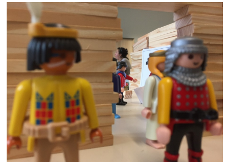
12 – La sortie de la salle de classe