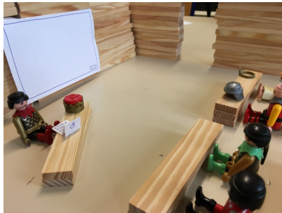
4 – L'appel