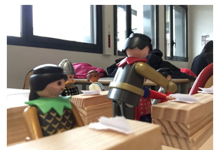
9 – La re-médiation individuelle