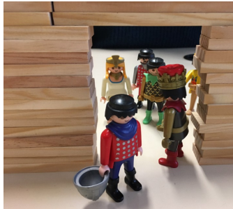
2 – L'entrée en classe