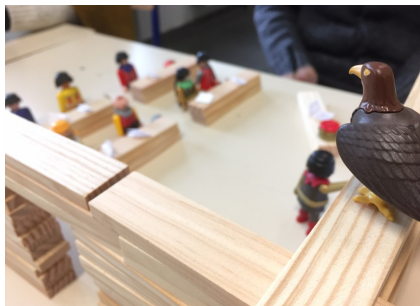
8 – La mise au travail