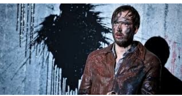
L'ennemi du peuple, Ibsen, Thomas Ostermaeier

Le totalitarisme ? Les outils de propagande ? Informations/désinformations ?