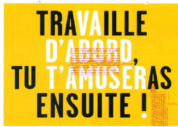
Affiche, Vincent Perrottet