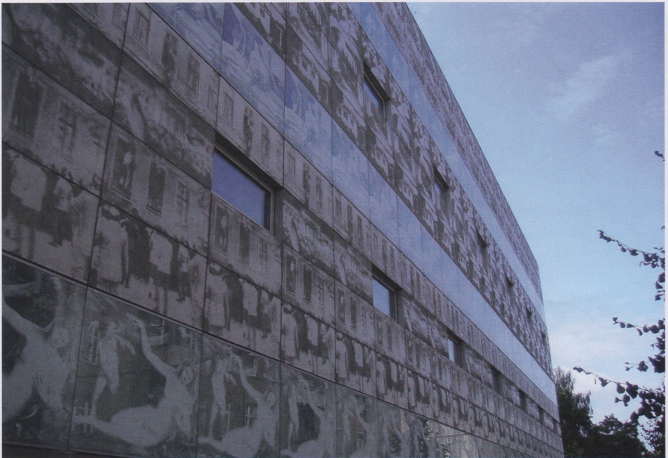
HERZOG & de MEURON , architectes, bibliothèque de l'école technique d'Eberswalde en Allemagne, 1997-1999.